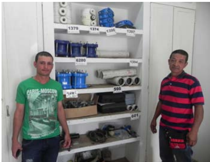
Dos trabajadores de la sede Sevilla de ACUAVALLE, quienes capacitaron a los operadores del acueducto La Sirena en la detección y reparación de fugas.

Foto: Madeleine Bélanger D., 20 de octubre de 2013.