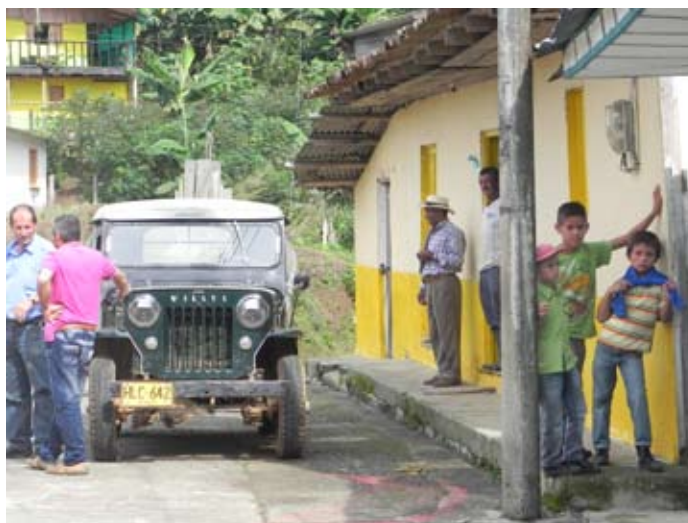
Antes de la asamblea para debatir un acuerdo entre los sindicatos y el acueducto comunitario en La Melba, Valle del Cauca. 20 de octubre de 2013.

Valle del Cauca, CVC. Los activistas regionales también han trabajado para preservar y fortalecer la capacidad de los acueductos operados por y que pertenecen a la comunidad, especialmente a través de una alianza entre trabajadores y la comunidad en La Sirena (un suburbio pobre de Cali) que ha inspirado otras iniciativas de solidaridad con los grupos rurales de la región.