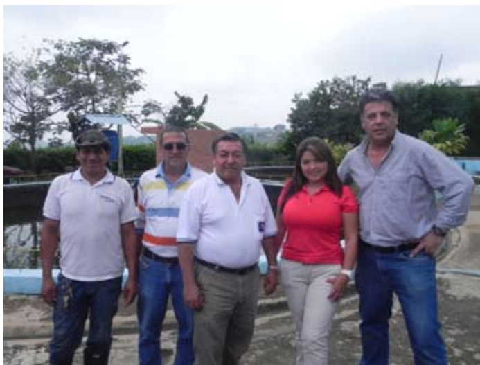
Equipo de la Asociación de Suscriptores del Acueducto del Barrio La Sirena durante la visita de la planta, con dos representantes de SINTRACUAVALLE. Foto: Madeleine Bélanger D., 15 de octubre de 2013.

En general, la estructura para la gestión y de costo ha servido como un modelo de eficiencia y transparencia entre sus similares en la asociación regional AQUACOL. Sin embargo, sigue alimentando el debate la dependencia del acueducto en el trabajo voluntario; otro factor es el tema de los subsidios a los que tiene derecho, pero a los que prefiere no acceder por no volverse vulnerable a recursos inciertos del gobierno (el 99 por ciento de los suscriptores son de 'estrato 1' y pagarían menos si utilizaran la metodología tarifaria de la Comisión de Regulación de Agua Potable y Saneamiento Básico, ver Roa García y Pulido Roza 2014).